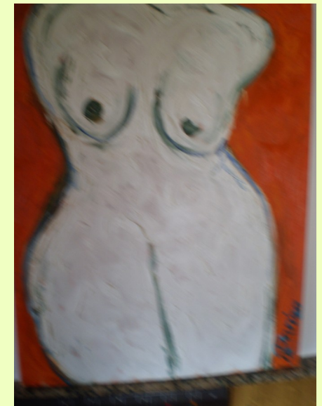
MARINA FERNÁNDEZ 'COCÓS'